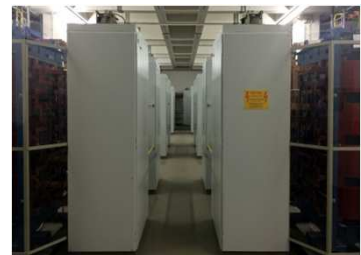
Prüffeld DC, 6 MW