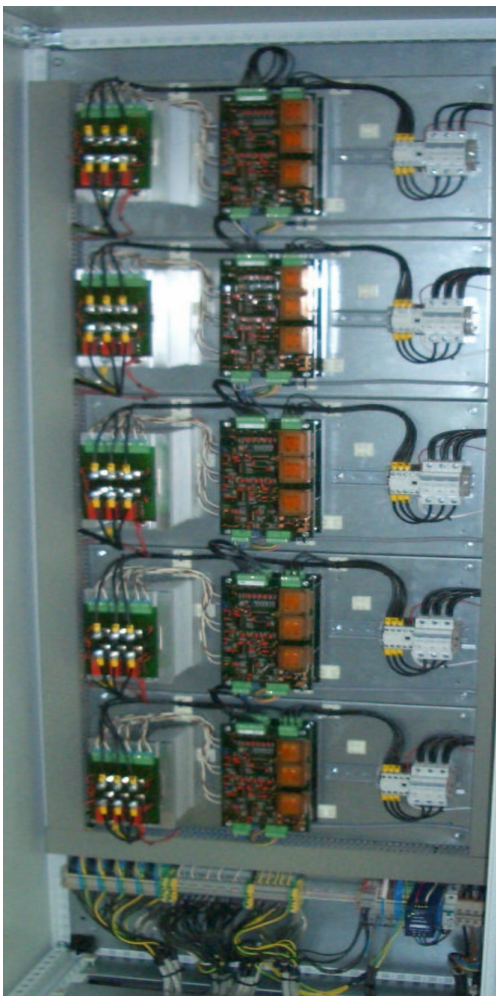
Projekt 1: 5 GR

Aufwandsfaktor \ll 0,5 gegenüber Neuausrüstung